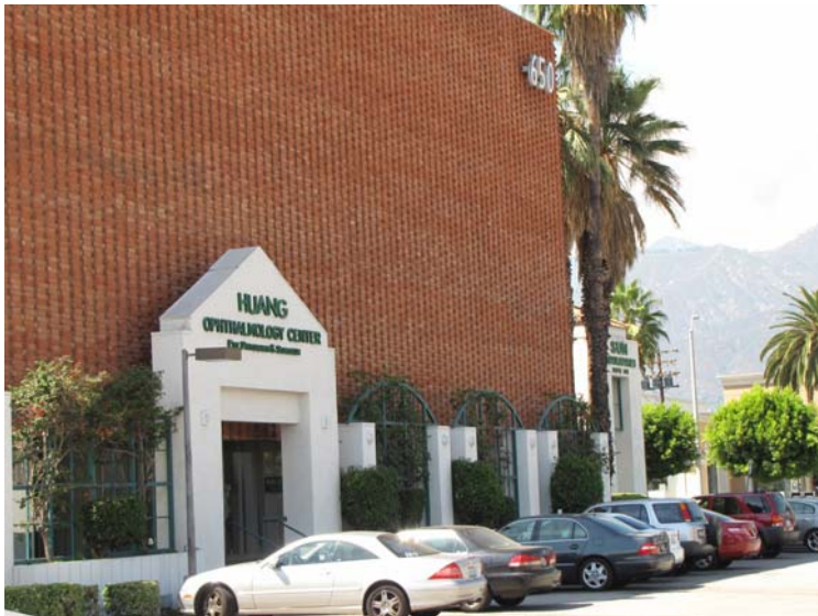
HUANG OPHTHALMOLOGY CENTER 650 W. Duarte Road, #100-D, Arcadia, CA 91007 Tel: 626-446-6682

對於青光眼，暫時還沒有特殊的治療方法，但可以由幾個方面的治療控制高眼壓這個導致視力喪失的頭號因素，並且防止病情進一步的惡化。大部分的病人對於控制危險級別眼壓的方法是使用滴眼液。有時需要多種藥物配合治療，以充分減輕壓力。當藥物無法把眼壓恢復到正常的水平，則需要運用雷射治療。恢復眼壓，治療改善青光眼目的是為了讓眼睛的代謝系統通暢，能更順利地排出水份。